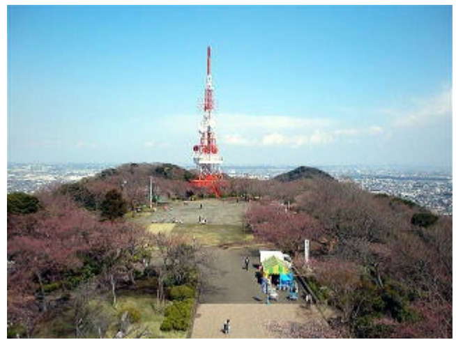
湘南平（千畳敷）標高179メートル