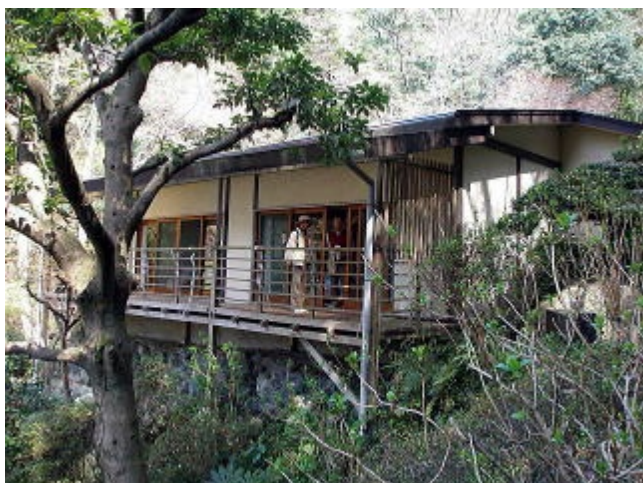
大磯園こいずみ 前には余綾(こよろぎ)の池