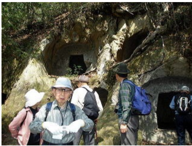
楊谷寺谷戸横穴群（4段配列27穴からなる）墓場