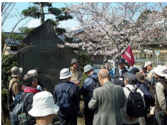
妙大寺内松本順(良順)の墓 大磯海水浴場を開いた。