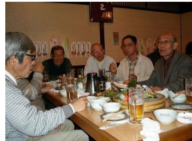
平塚駅前庄屋で2次会 19名が参加