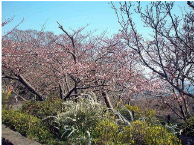
桜もこの暖かさで3分咲き