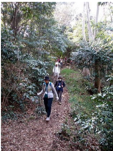
高麗山の途中には5メートルもある椿が咲き誇る