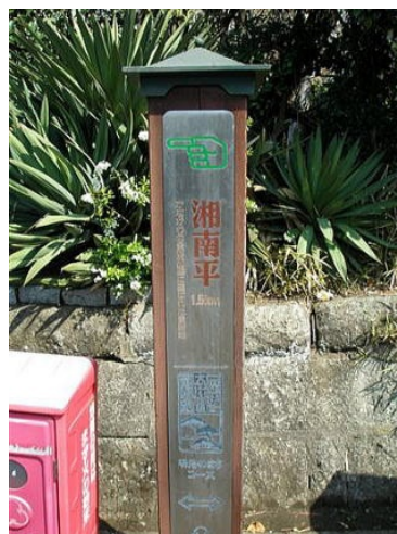
いざ湘南平へ出発!