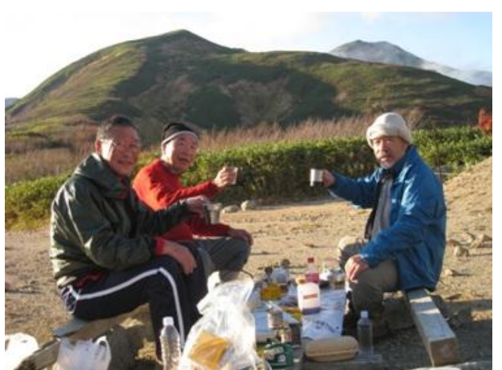
人物3人の前方は飯豊山・15日夕方4時頃夕食です