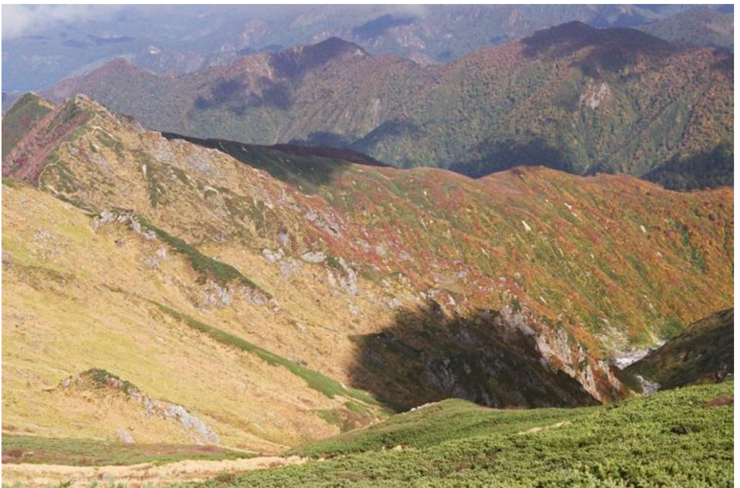
飯豊連の峰最高峰大日岳2128m