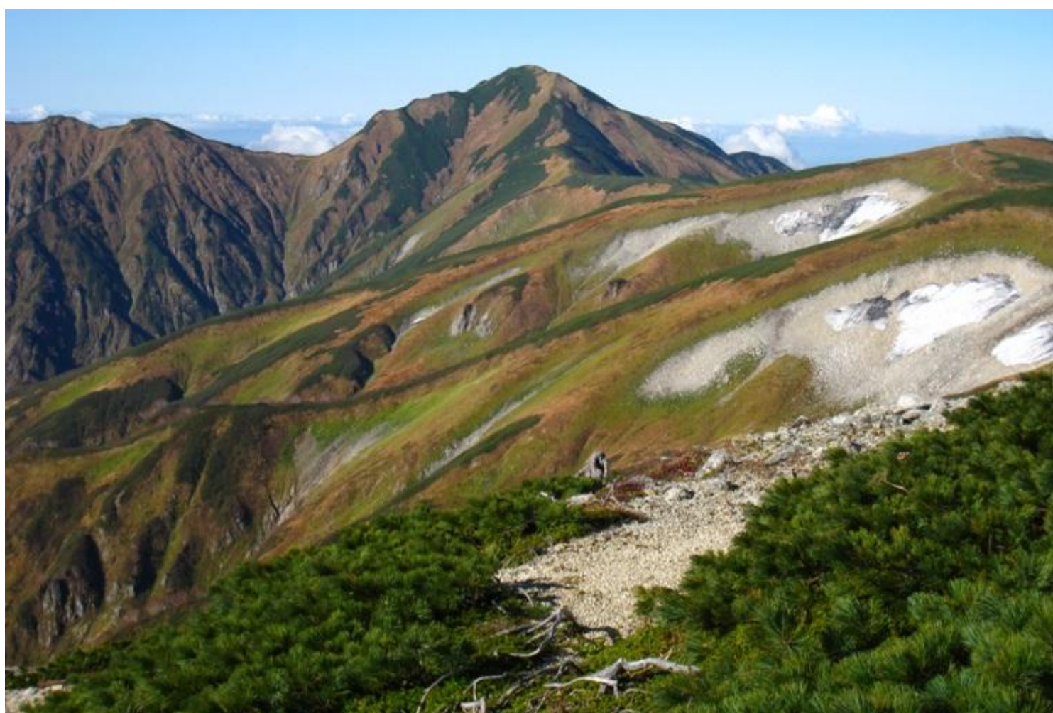
万年雪溪を見ながら飯豊山の勇姿です