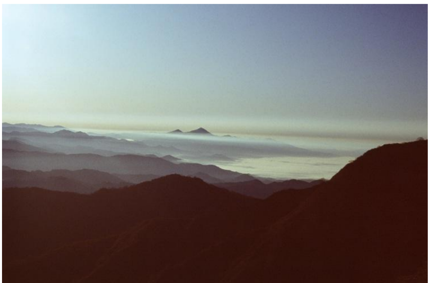
朝雲海の向こうに聳えて見えるのは磐梯山です