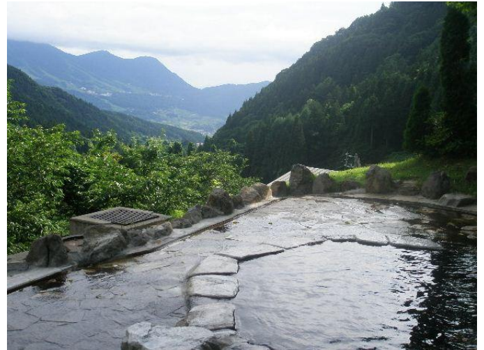
馬曲温泉 望郷の湯