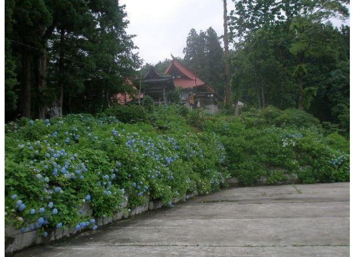
戸狩 高源院あじさい 1万本のアジサイが見事

3日目は、アジサイ寺とも言われる「高源院」で満開のアジサイを観賞、昼には美味しい信州そばと蕎麦焼酎を嗜みご満悦。旅の終わりは、飯山にて「奥信濃特産品まつり」を見物。太鼓や獅子舞などの郷土芸能を堪能して、帰途に着いた。