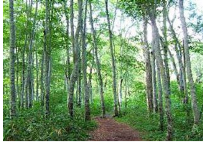
なだらかに続くブナの遊歩道