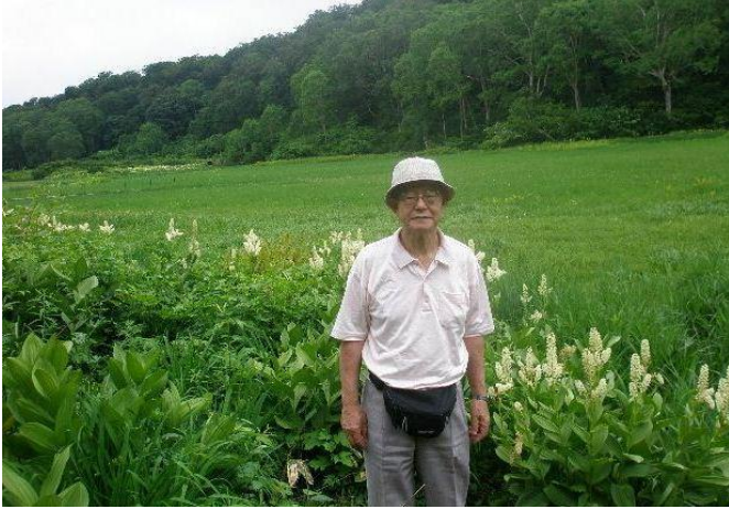
初夏の北ヤブ湿原にて

旅の2日目は「カヤの平高原」(上信越高原国立公園内)にトレッキング。”日本一美しい”とも評されるブナの原生林、高山植物の花咲く湿原、タケノコ狩り(カヤの平に自生するネマガリダケ)を楽しむ。映画「阿弥陀堂だより」のロケに使われたお堂に立ち寄り参拝、近くの「日本の棚田百選」に選ばれた「福島棚田の里」にて人と自然との共存を体感。2日目の宿は戸狩温泉の民宿、ホテル並みの設備を誇り郷土料理に舌つつみ。