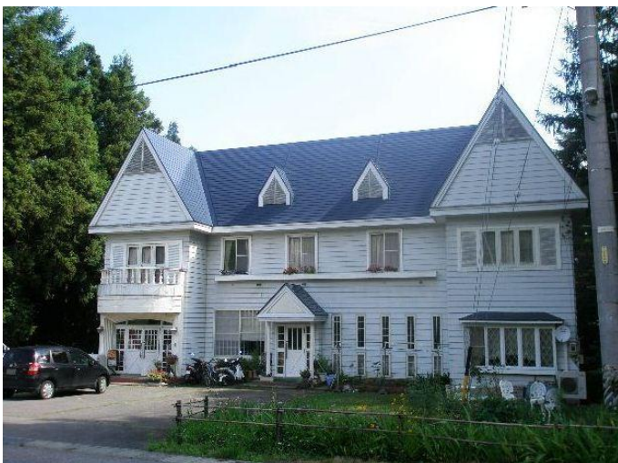
望郷の湯 ペンション かわしま 自家栽培の自慢の料理、体験メニューも沢山