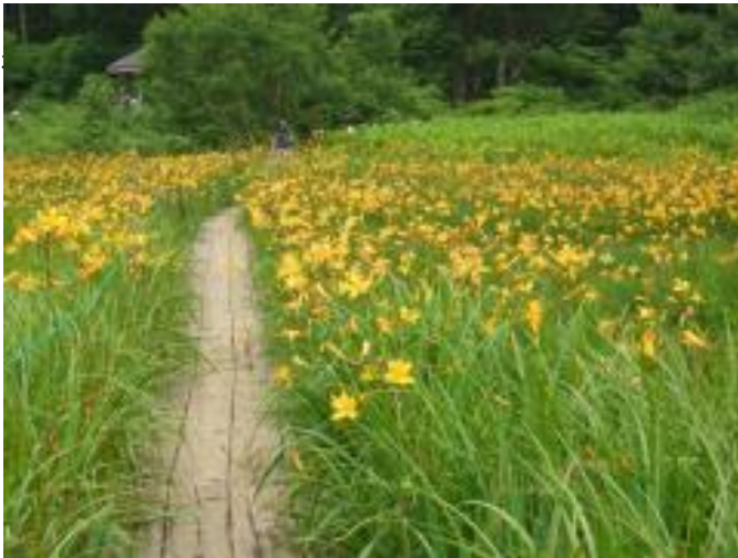
北ヤブ湿原に咲くニッコウキスゲ