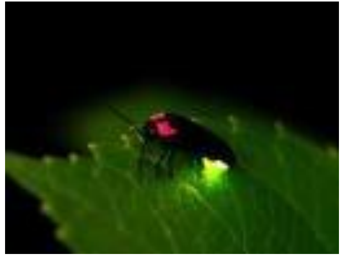
ゲンジホタル 幸運にもホタルがでる時期に巡り会った